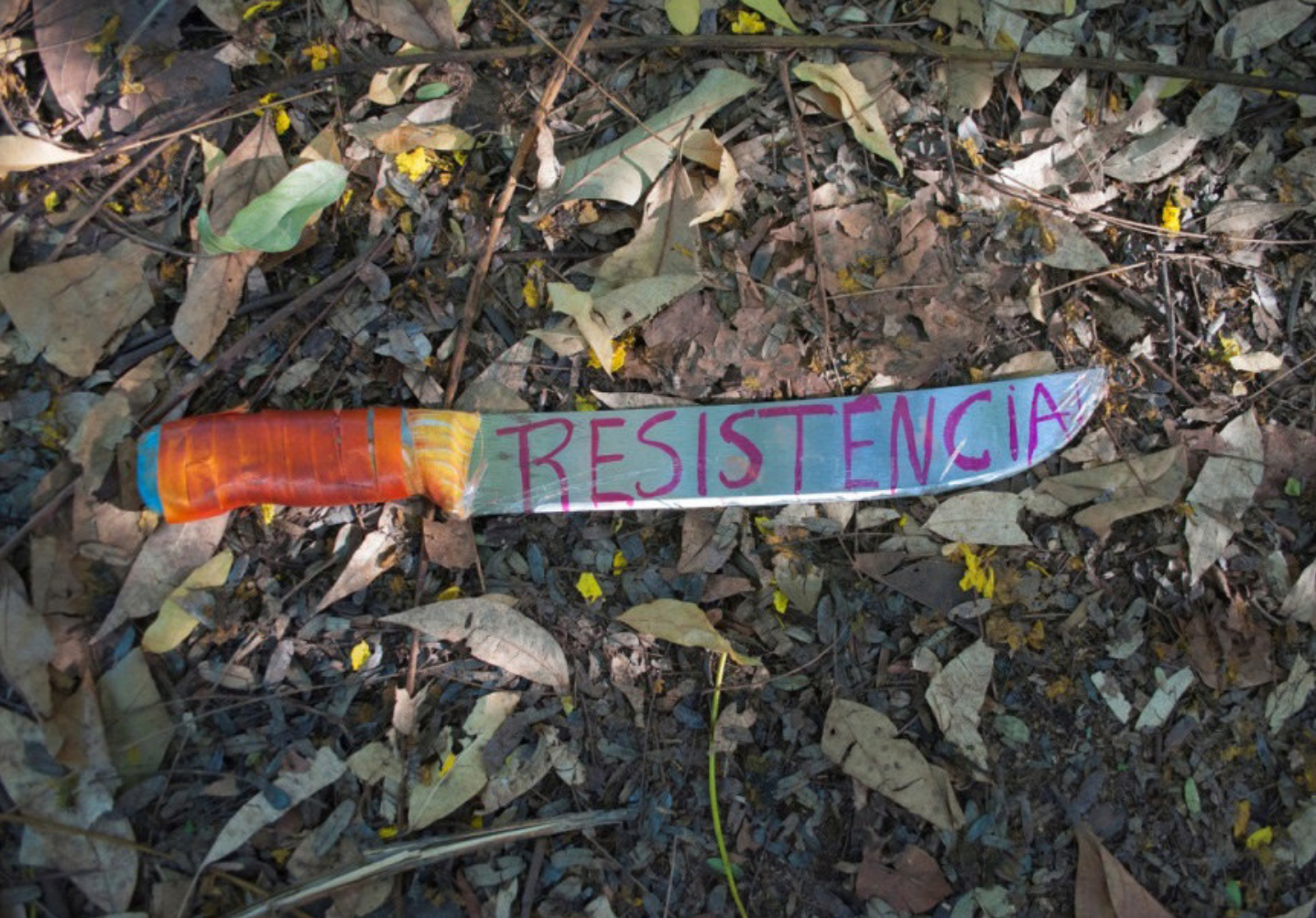
Figura 3. Detalhe da instalação Assentamento, Rosana Paulino, 2013.

Paulino modifica suas significações como algo feminino, doce, passivo e transforma-os em objetos violentos e repressivos, que machucam e emudecem. A escolha dos materiais feita por Rosana Paulino também é vista em outros trabalhos, como as obras Assentamento (2013) e Atlântico Vermelho (2016).