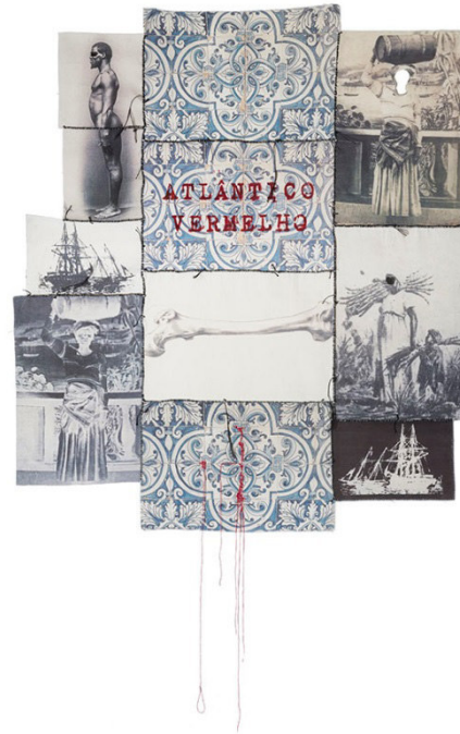
Figura 4. Atlântico vermelho, Rosana Paulino, 2017.

Suturas e sangue também são vistos em outra obra da artista, chamada Atlântico Vermelho (2016). Com a junção de diferentes elementos que remetem ao processo de invasão e dominação do território brasileiro, Rosana Paulino expõe novamente esse país construído a partir da exploração do povo africano, contrapondo diferentes representações do dominado e do dominante em paralelo.