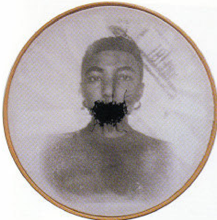
Figura 1. Imagem da série Bastidores. Rosana Paulino. Imagem transferida sobre tecido, bastidor e linha de costura. 30 cm diâmetro. 1997.

descoloniais; quando você entra no campo do quíchua e quechua, aymara e tojolabal, árabe e bengali etc.". Nessas culturas não existia a separação das coisas em categorias como a imposta pelo eurocentrismo, como o mente/corpo, europeu/não-europeu, por exemplo.